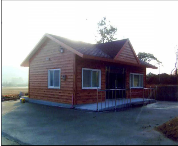
● 소보면 도산1리