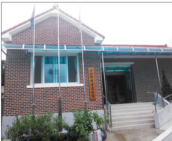
● 소보면 송원리