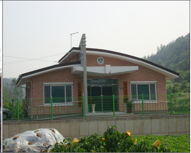
● 효령면 화계3리