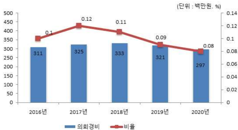
의회경비 연도별 집행액 및 비율 변화