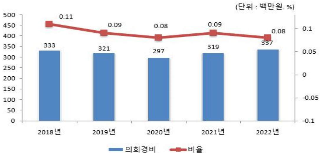
의회경비 연도별 집행액 및 비율 변화